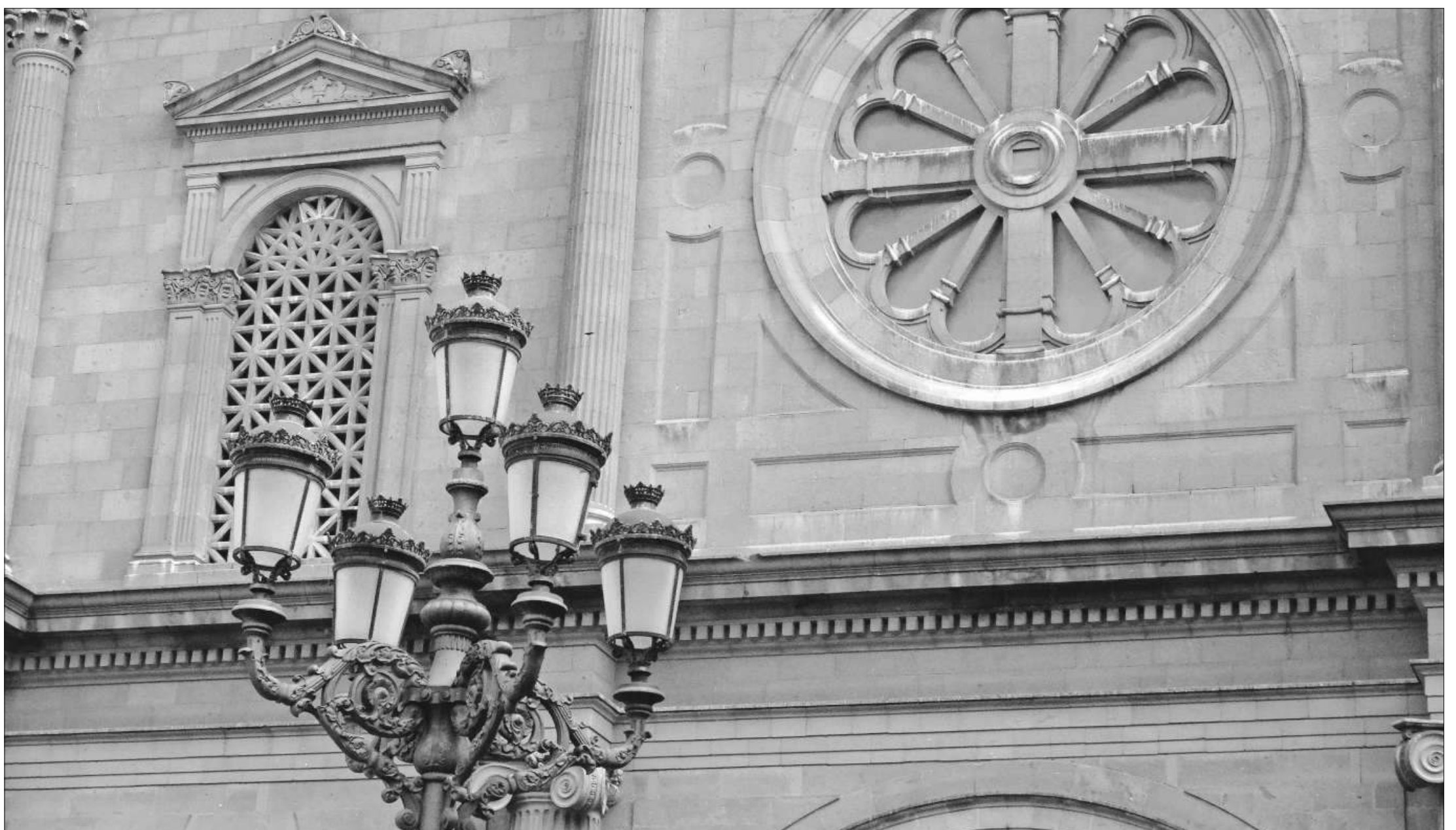
«Aus der Dunkelheit brach ein Licht und erleuchtete meinen Weg.» (Khalil Gibran) Laternen vor der Westfassade der Kathedrale Santa Ana in Las Palmas.

Die Kameraden und Freunde der Noggeler Guuggenmusig Luzern