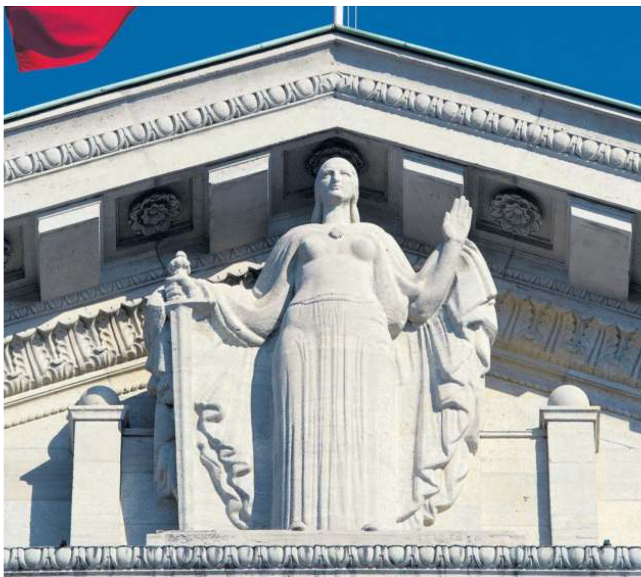
Justitia-Statue am Gebäude des Bundesgerichts in Lausanne.

Als Folge davon sei auch die Auswahl an Kandidaten beschränkt. Auf Bundesebene sei das weniger ein Problem als in den Kantonen, die in ihren Gerichten ebenfalls den Parteienproporz kennen.